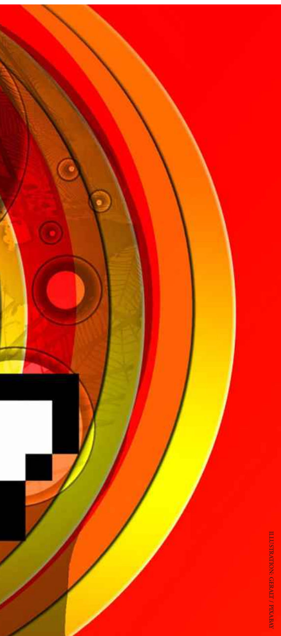
ILLUSTRATION: GERRIT / FIMMARI

● Digitale Selbstethnografie: Hier haben wir in die Küchen unserer Teilnehmerinnen und Teilnehmer geschaut, sie ihre Problemfelder erkunden lassen und schließlich potenzielle Lösungen angeboten. Analog zu YouTube wurden dazu Unboxing Videos gedreht. So wird der erste Produkteindruck im natürlichen Habitat quasi „live“ eingefangen.